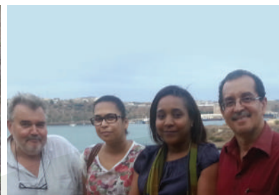
Ex-alunos do IHMT