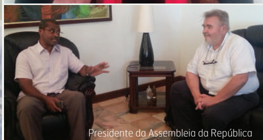
Presidente da Assembleia da República