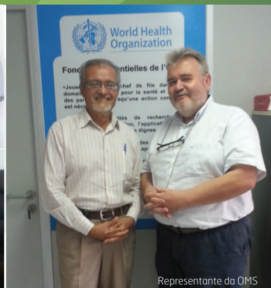
Representante da OMS