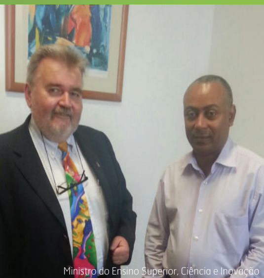
Ministro do Ensino Superior, Ciência e Inovação

Boletim informativo | Ano 3 | Nº 32 | 31.08.2014