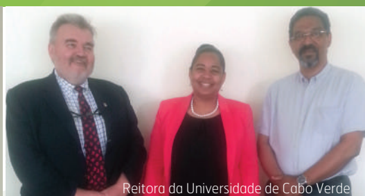
Reitora da Universidade de Cabo Verde